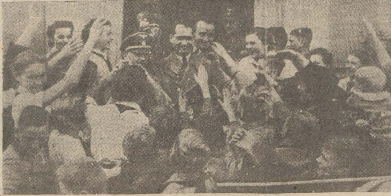
Hess yaverleri ile beraber halk arasında

6 ayda pratik usul ile İngilizce Onsekizinci ders 5 nci sayfada