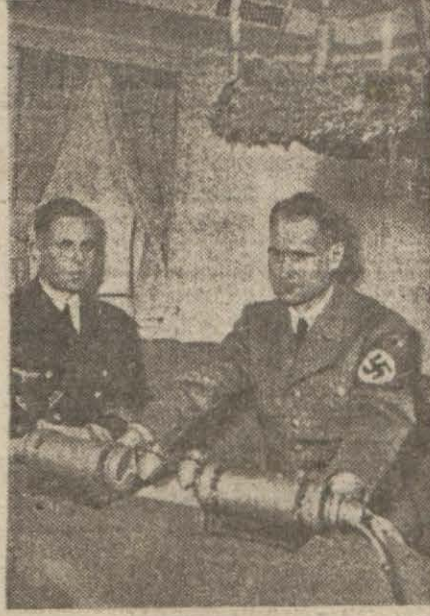
Hess'in en son resimlerinden biri. Nazi şefi geçen yıl başı yortusunda radyo önünde halka hitab ederken

Londra 14 (A.A.) — Reuter'in parlamento muharriri bildiriyor: Başvekil B. Çörçil'in Rudolf Hess'i görmesi gayri muhtemel te- lâkki edilmektedir. Hess'e, yaralı bir harb esiri muamelesi yapılmak- tadır. Hess'i görmeğe gitmiş olan hariciye memurlarından Kirkpat- rick, hâlâ Londra'ya dönmemiştir. Çörçil'in yakında Hess hakkında Avam Kamarasında bir beyanatta bulunacağı ümit edilmektedir. (Devamı 3 üncü sayfada)